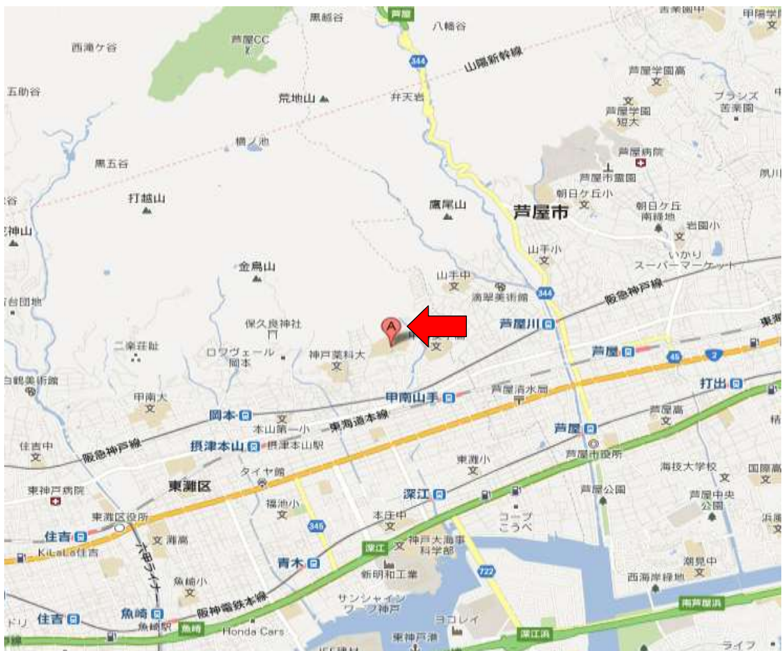
甲南大学女子大学(ふれあいの森)