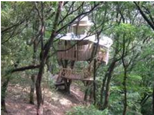
活動場所(甲南女子大学学習林 コナラ林内に建つツリーハウス)

そこで生育するススキが茅葺やイベントに利活用されれば嬉しいなと思って草やネササを刈っています。