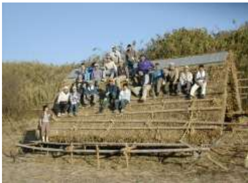
茅葺講座受講生たち(明石海峡公園神戸地区(仮称)にて2004年3月)