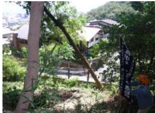
活動場所(甲南女子大学学習林 住宅地隣接部での伐採状況)