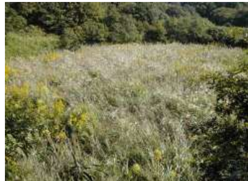
ススキの原(明石海峡公園神戸地区(仮称)内 放棄地ネササ刈取り部)